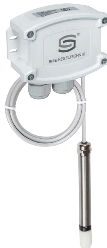
RPTM 1-wModbus senza display (wireless)